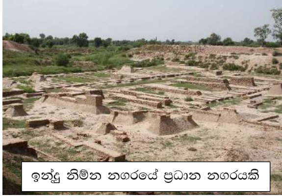
ඉන්දු නිම්න නගරයේ ප්‍රධාන නගරයකි