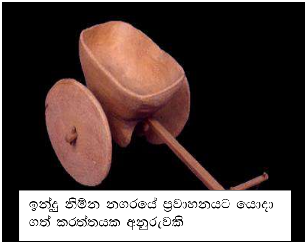
ඉන්දු නිම්න නගරයේ ප්‍රවාහනයට යොදා ගත් කරත්තයක අනුරුවකි