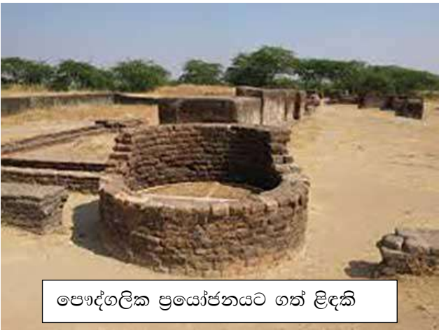
පෞද්ගලික ප්‍රයෝජනයට ගත් ලිඳකි