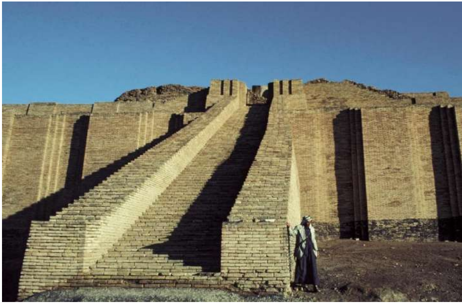
පැරණි උර් නගරයේ පිහිටි මෙසපොතේමියානු සිගුරට් දේවාලයකි

දේවමණ්ඩලයේ ප්‍රධානියා → අනු පොළවට අධිපති දෙවියා → එන්කිකි සුළඟට සහ ගොවිතැනට අධිපති දෙවියා → එන්ලිලි. දෙවියන්ට පුද පූජා පැවැත්වීමට තැනූ දේවාල → සිගුරට්