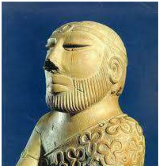
ඉන්දු නිම්න ශිෂ්ටාචාරයට අයත් මූර්තියකි. පූජකරුවන් යැයි විශ්වාස කෙරේ